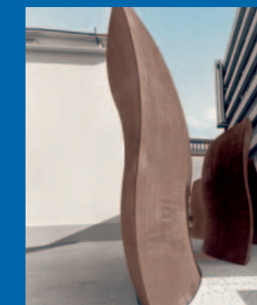
Entladen und Positionierung mit Kran → Ausrichten und Endmontage nach Kundenvorgaben → "Dirk's Pod" auf dem Novartis-Campus des Wissens.