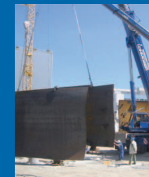
...Verladen auf Spezialfahrzeuge → Transport vom Hafen an den Aufbauplatz