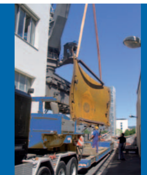
Erstellen eines Projektplanes → Vortransport der Skulpturen per Binnenschiff → Verzollungen / Genehmigungen einholen → Entladen und...